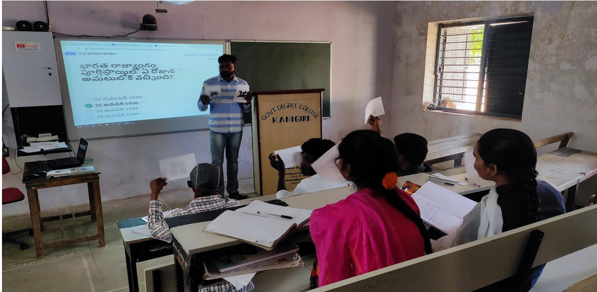
Teacher Displaying Questions on the Digital Board

Topics were given to the students from the completed chapters, Introduction to Political Science, Indian Constitution and Approaches to the Study of Political Science and State. Students actively participated in the Quiz with enthusiasm.