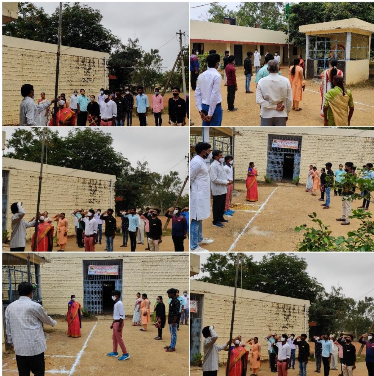
Students and Staff participating in Republic Day Celebrations