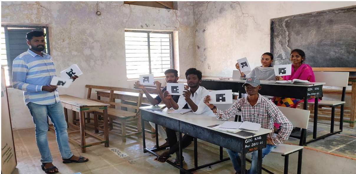
Students showing Plickers Cards for Scanning the Answers