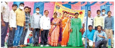
సమావేశంలో పాల్గొన్న పూర్వ విద్యార్థులు