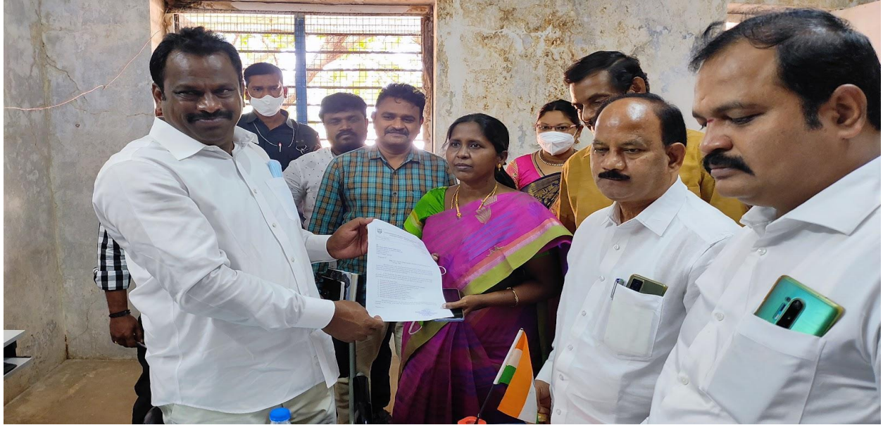
Principal and Staff Submitting a copy of requirements to the college to Honorable MLA