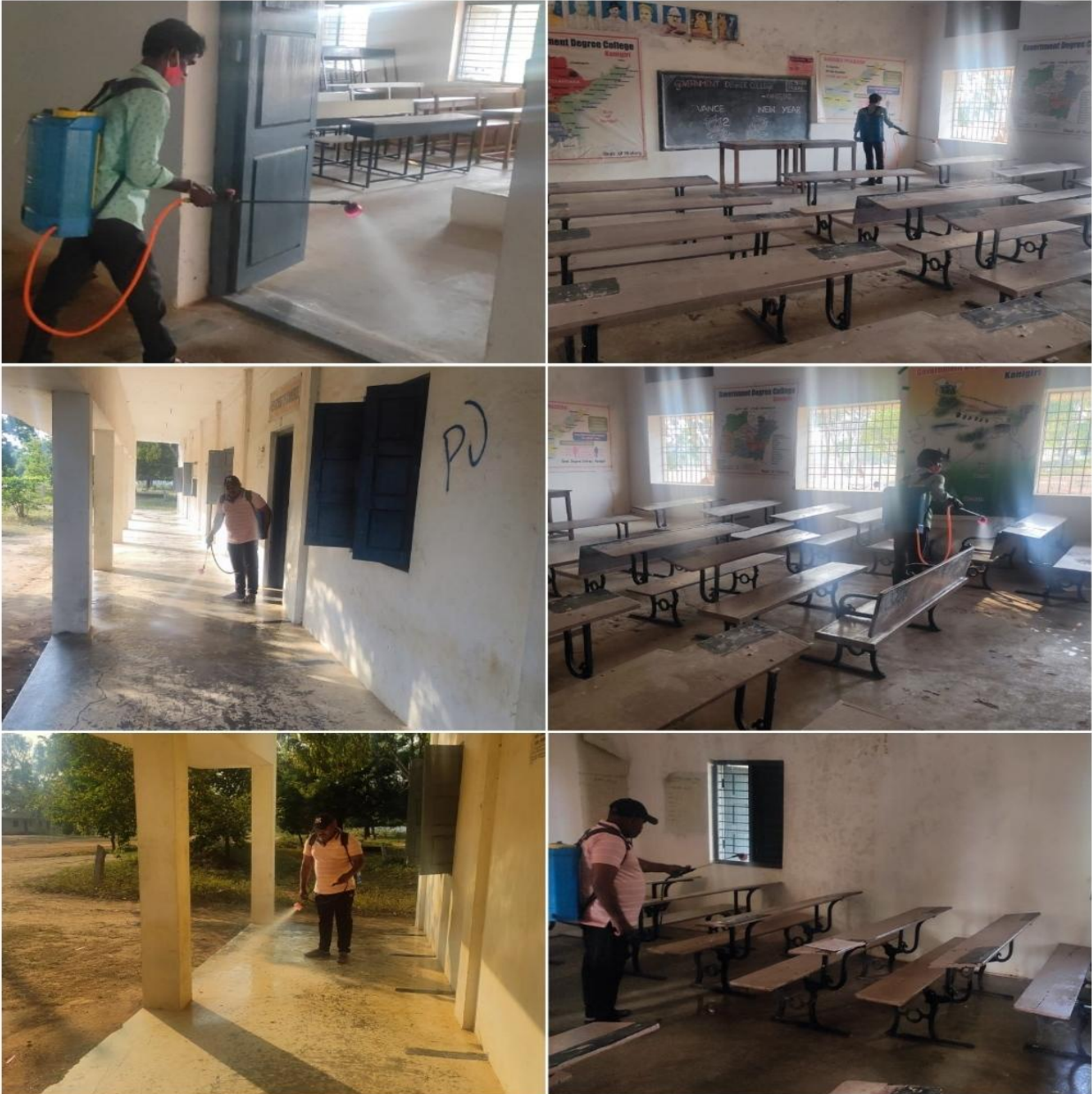
Municipal Frontline Soldiers sanitizing the classrooms and college premises