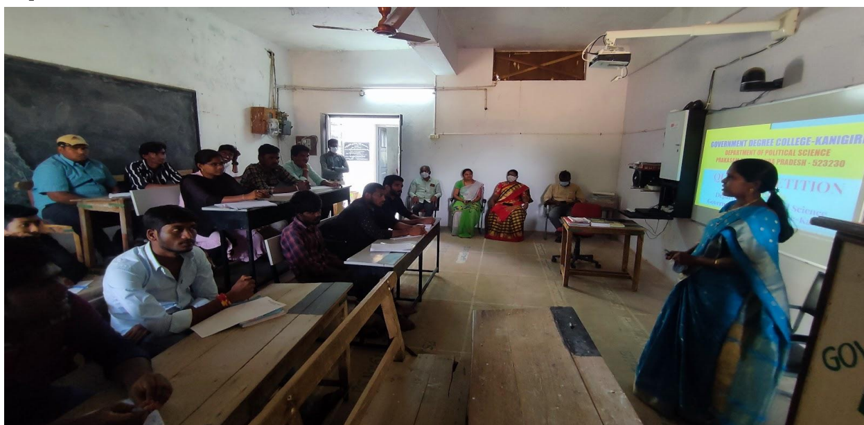
Principal Addressing Quiz Competition

Students were divided into 6 Groups namely A,B,C,D,E,F consisting of 1st, 2nd, 3rd Year Students & from different courses like B.A, B.Com.(College doesn't have a B.Sc Course). In each round, students were asked 12 Questions, 6 questions in Clockwise direction and 6 questions in Anticlockwise direction. Each direct question carries 10 marks and a pass question carries 5. Students were amazed with the way the quiz was conducted and they were surprised by the type of questions asked.