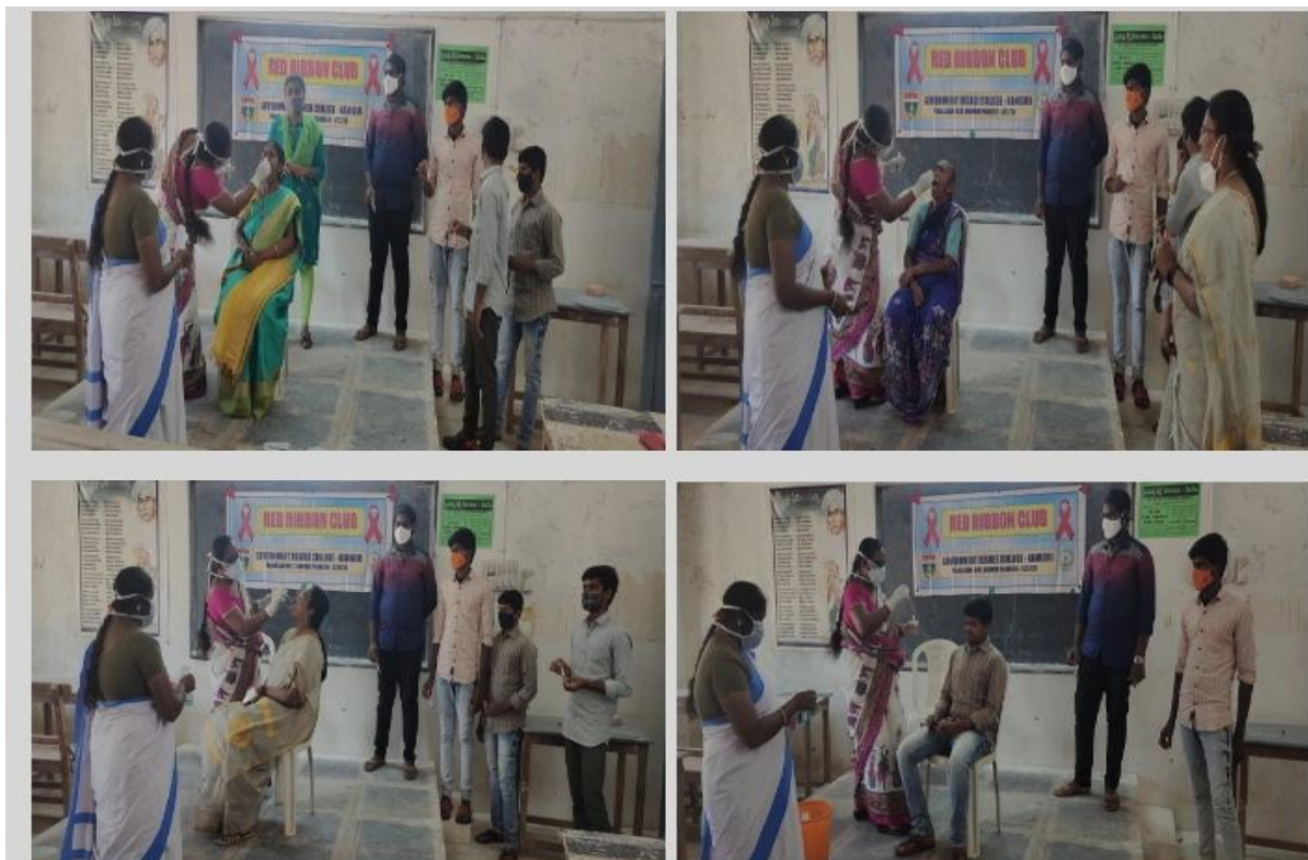
Principal, Staff and Students taking part in the Covid-19 Testing