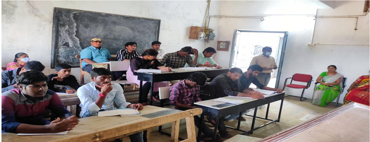
Students were actively participated in the Republic Day Quiz