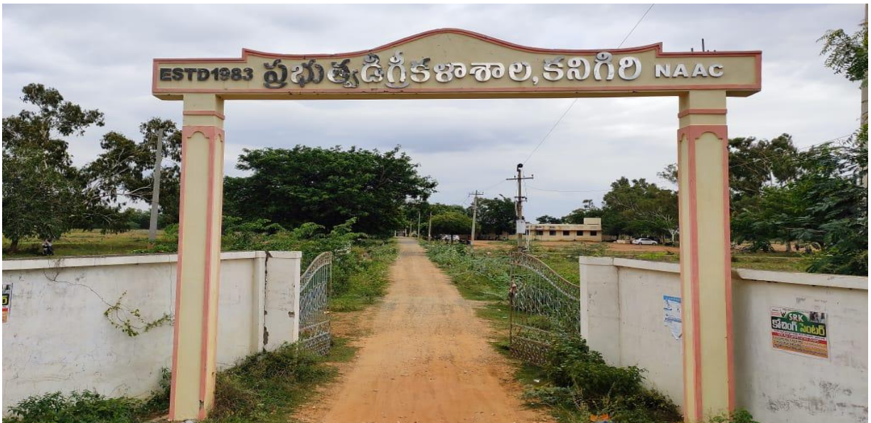
GOVERNMENT DEGREE COLLEGE - MAIN GATE ENTRANCE

Located in rural environment, Government Degree College Kanigiri, is imparting quality education with values through blended teaching and learning process. Our students are the learners of today and are well trained to face the challenges of a highly competitive future. In both curricular and co curricular activities our students have been doing well. Implementing Swachh Bharat, conducting awareness programmes of covid-19, celebrating national importance programs to create a sense of responsibility in all the students. The active participation of the students in eco-clubs, consumer club, alumni association enhances good administration and academic excellence of the institution. Being an excellent destination for quality education, Government Degree College Kanigiri with its dedicated faculty and staff are making the students well-trained for multifaceted fields.