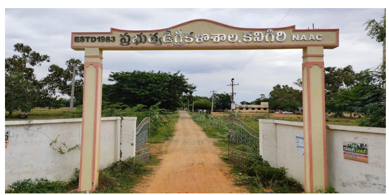
GOVERNMENT DEGREE COLLEGE - MAIN GATE ENTRANCE

Located in rural environment, Government Degree College Kanigiri, is imparting quality education with values through blended teaching and learning process. Our students are the learners of today and are well trained to face the challenges of a highly competitive future. In both curricular and co curricular activities our students have been doing well. Implementing Swachh Bharat, conducting awareness programmes of covid-19, celebrating national importance programs to create a sense of responsibility in all the students. The active participation of the students in eco-clubs, consumer club, alumni association enhances good administration and academic excellence of the institution. Being an excellent destination for quality education, Government Degree College Kanigiri with its dedicated faculty and staff are making the students well-trained for multifaceted fields.