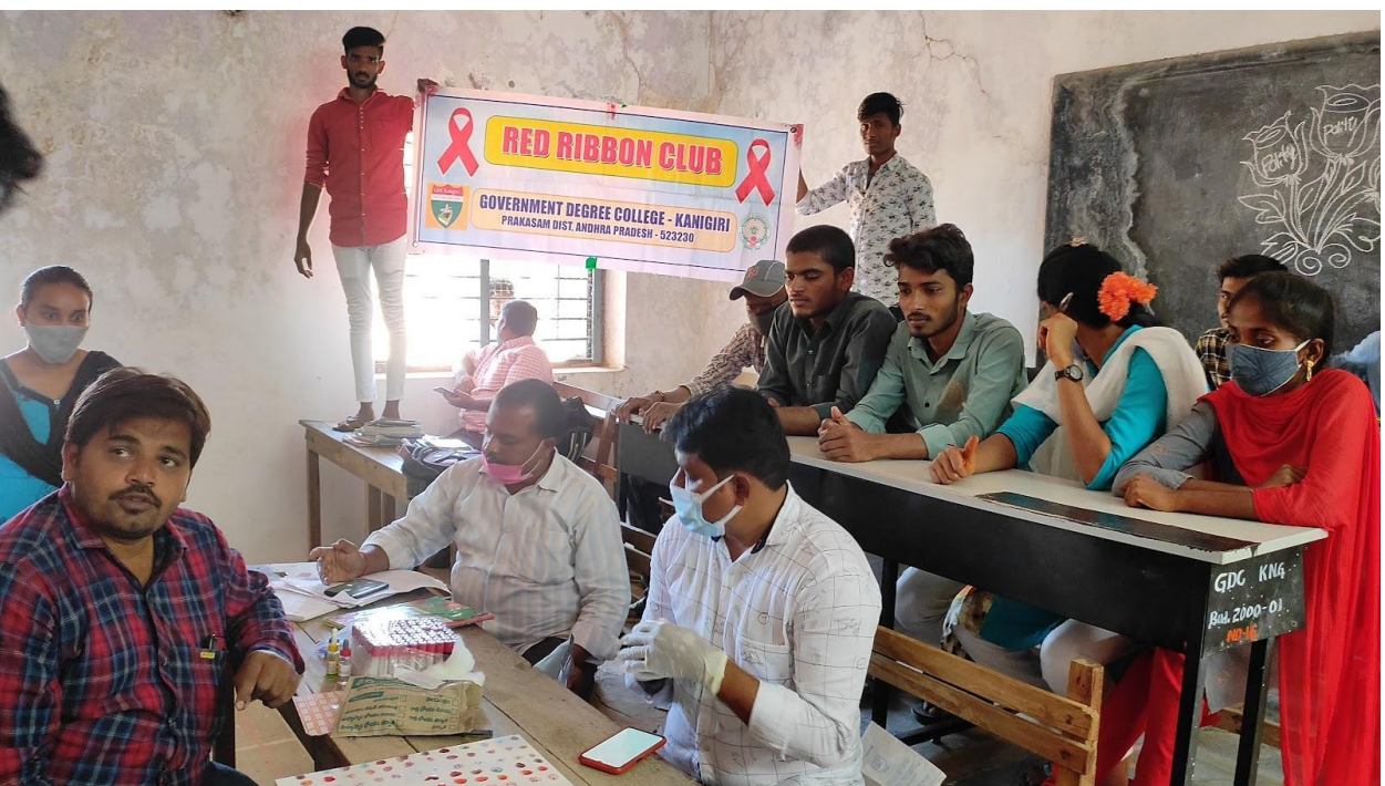
Students and Health Department Officials of Area Hospital Kanigiri taking part in Blood Grouping Camp