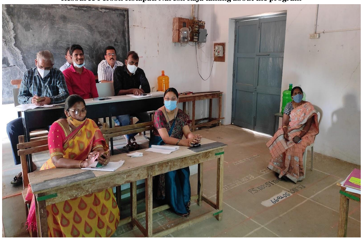
Staff Members participating in the Orientation Session