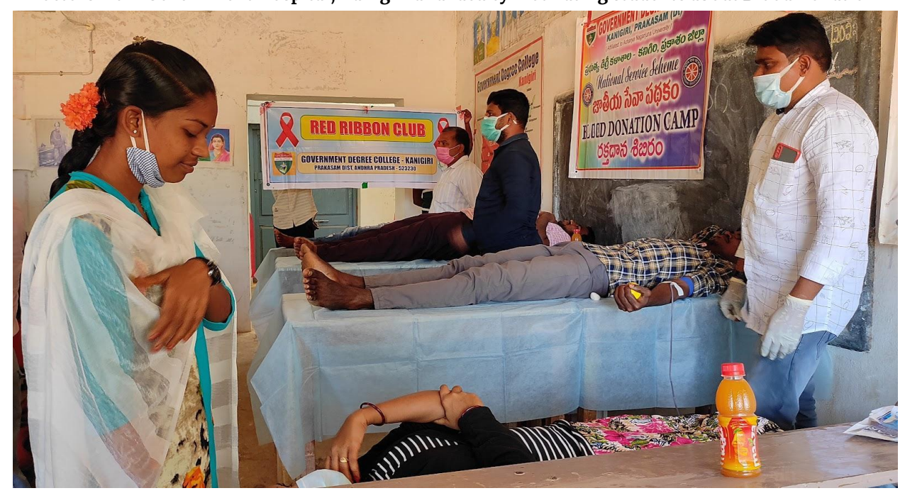
Students of GDC Kanigiri Donating Blood