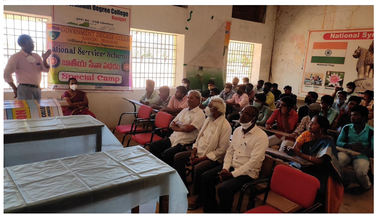
Doctors from Government Hospital, Kanigiri and faculty motivating students about Blood Donation

A Blood Donation Camp was organized by the RED RIBBON CLUB, in association with NSS Unit of Government Degree College, Kanigiri on 28th February 2022. Volunteers from NSS and Red Ribbon Club were motivated by the Doctors and FAculty to Donate Blood to save lives.