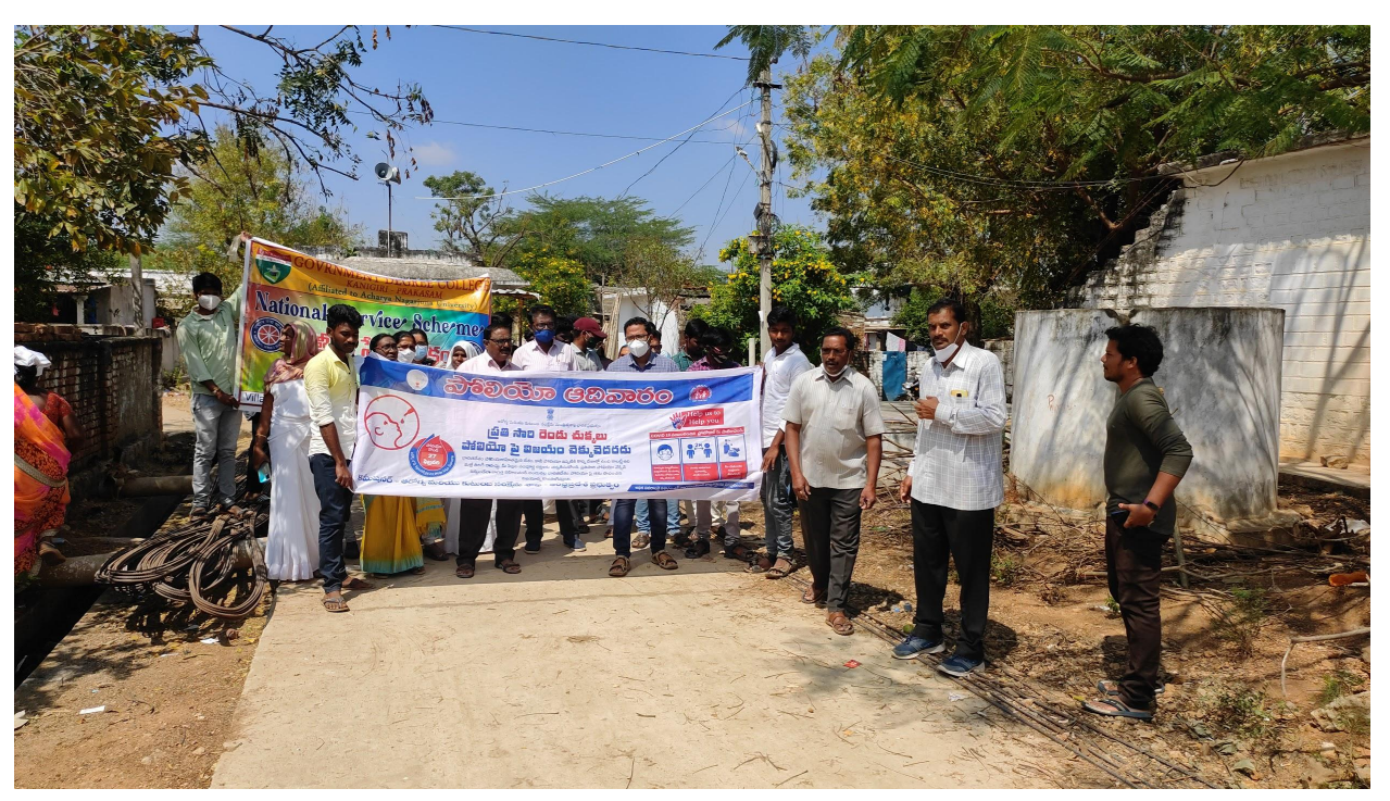
Staff, NSS Volunteers Taking Part in Pulse Polio Rally