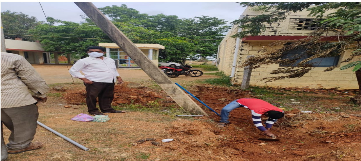
swatch bharat program