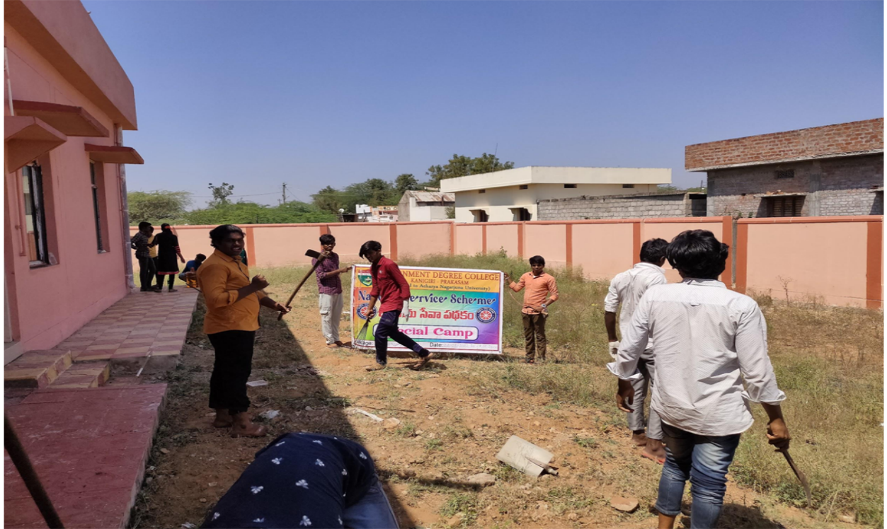
Swachh bharaat program