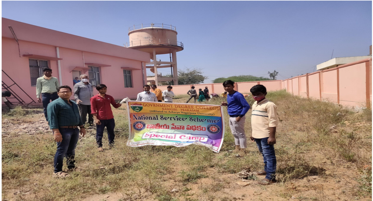
Clean and green swatch bharat program