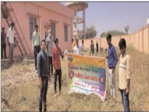
కనిగిరి, మేజర్ న్యూస్ : జాతీయ సేవా కార్యక్రమంలో భాగంగా స్థానిక

ప్రభుత్వ డిగ్రీ కళాశాలలోని 50 మంది ఎన్ఎస్ఎస్ వాలంటీర్లు మాచవరం లోని ప్రాథమిక ఆరోగ్య కేంద్రం, ప్రభుత్వ పాఠశాలలో పిచ్చి మొక్కలను తొలగించి శుక్రవారం స్వచ్ఛభారత్ కార్యక్రమం నిర్వహించారు. అలాగే మాచవరం గ్రామంలో కంటి శుక్లంపై వాలంటీర్లు సర్వే నిర్వహించారు. స్వచ్ఛ భారత్ కార్యక్రమంలో పాల్గొన్న ఎన్ఎస్ఎస్ వాలంటీర్లను