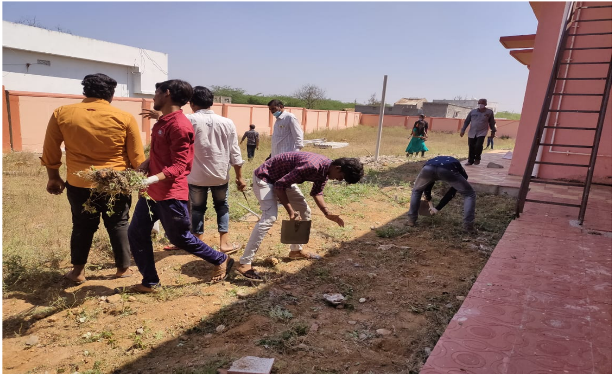
Today we conduct swachh bharaat program at machavaram in government hospital premises.... With students