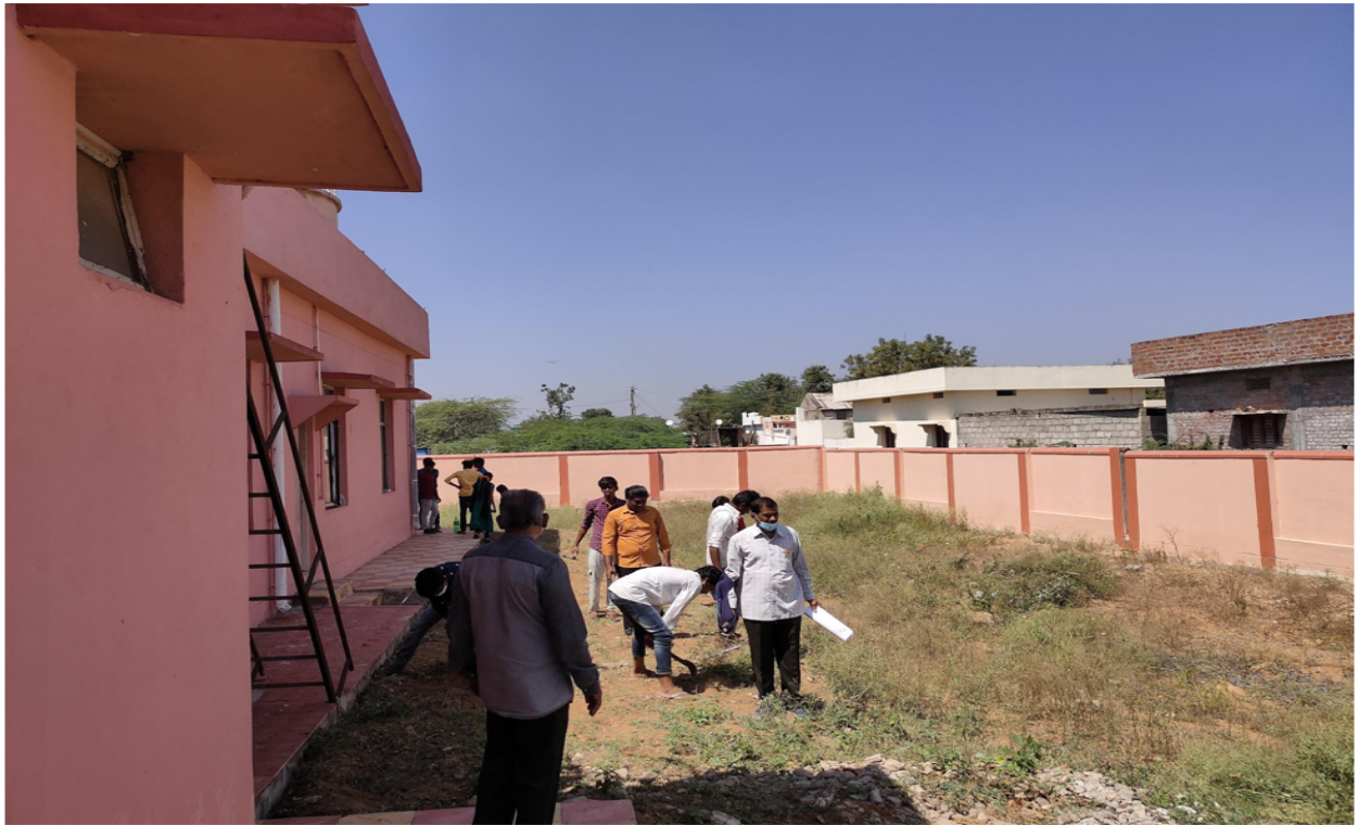
Hospital right side Cleaning