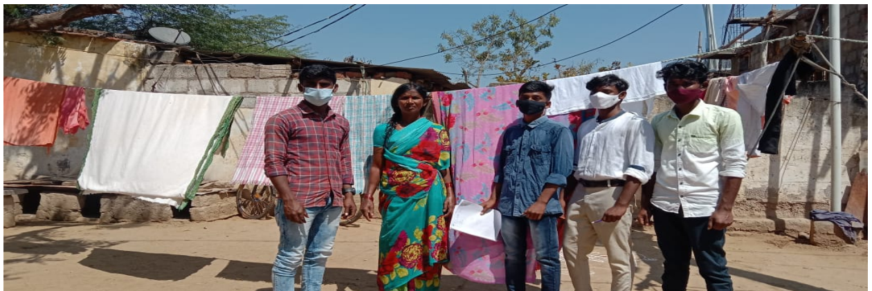
Covid19-Vaccination Awareness Programme by our college students at Machavaram Village