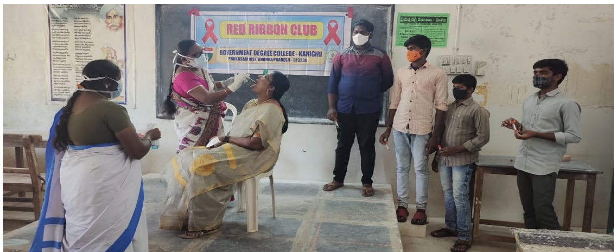
Covid-19- Vaccination Drive Conducted at Government Degree college-Kanigiri